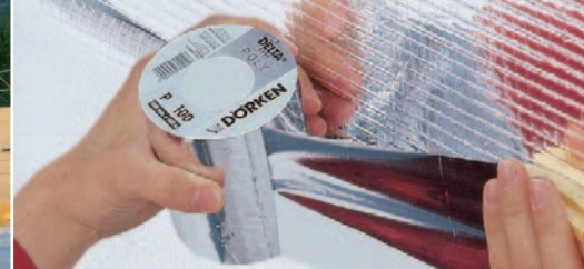
DELTA®-REFLEX PLUSZ integrált öntapadó ragasztószegéllyel.