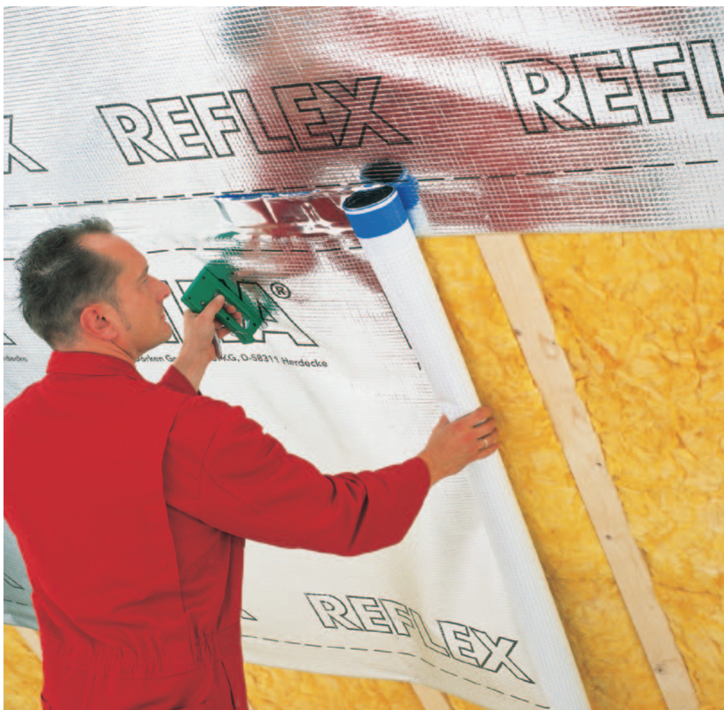
DELTA®-REFLEX – az univerzális lég- és párazáró fólia.

A DELTA®-REFLEX PLUSZ az integrált ragasztószáv által még gyorsabb légzáró beépítést tesz lehetővé.