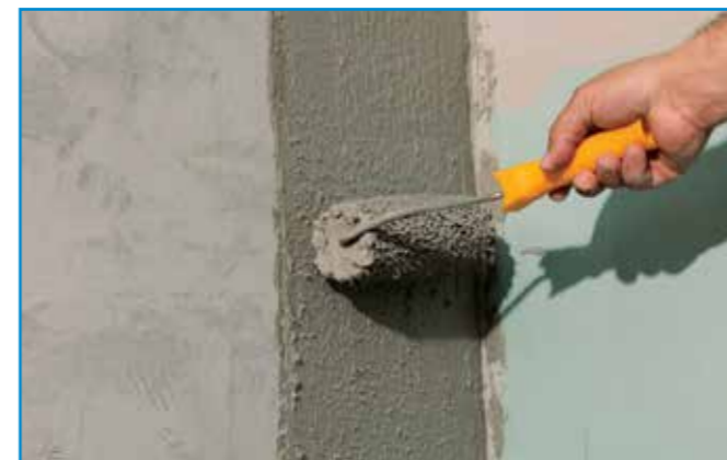
A kenhető szigetelés első rétegét a teljes felületre, sarkokba, élekre is kenjük fel.

Bedolgozhatósági idő: Az anyag a bekeverés befejezésétől kb. ennyi ideig használható fel (átkeverés szükséges lehet)