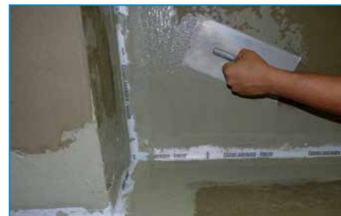
A hajlaterősítés beágyazása után a teljes felületre felhordjuk a második réteg vízszigetelést.