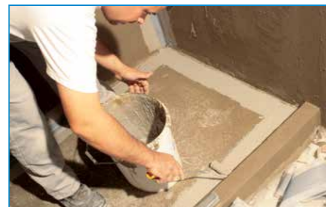
A hajlaterősítő szalag beágyazását az első réteg szigetelés száradása után kezdhethetjük meg.