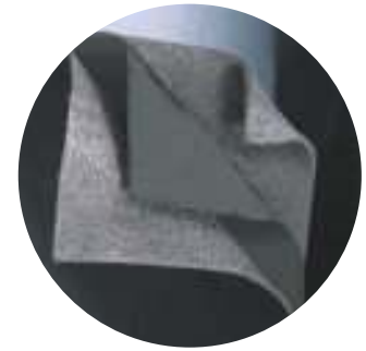
3 rétegű APLOMB 22

(Léghanggátlási képessége a 100-3150 Hz frekvenciatartományban, MSZ EN ISO 717-1: 2000 szerint)